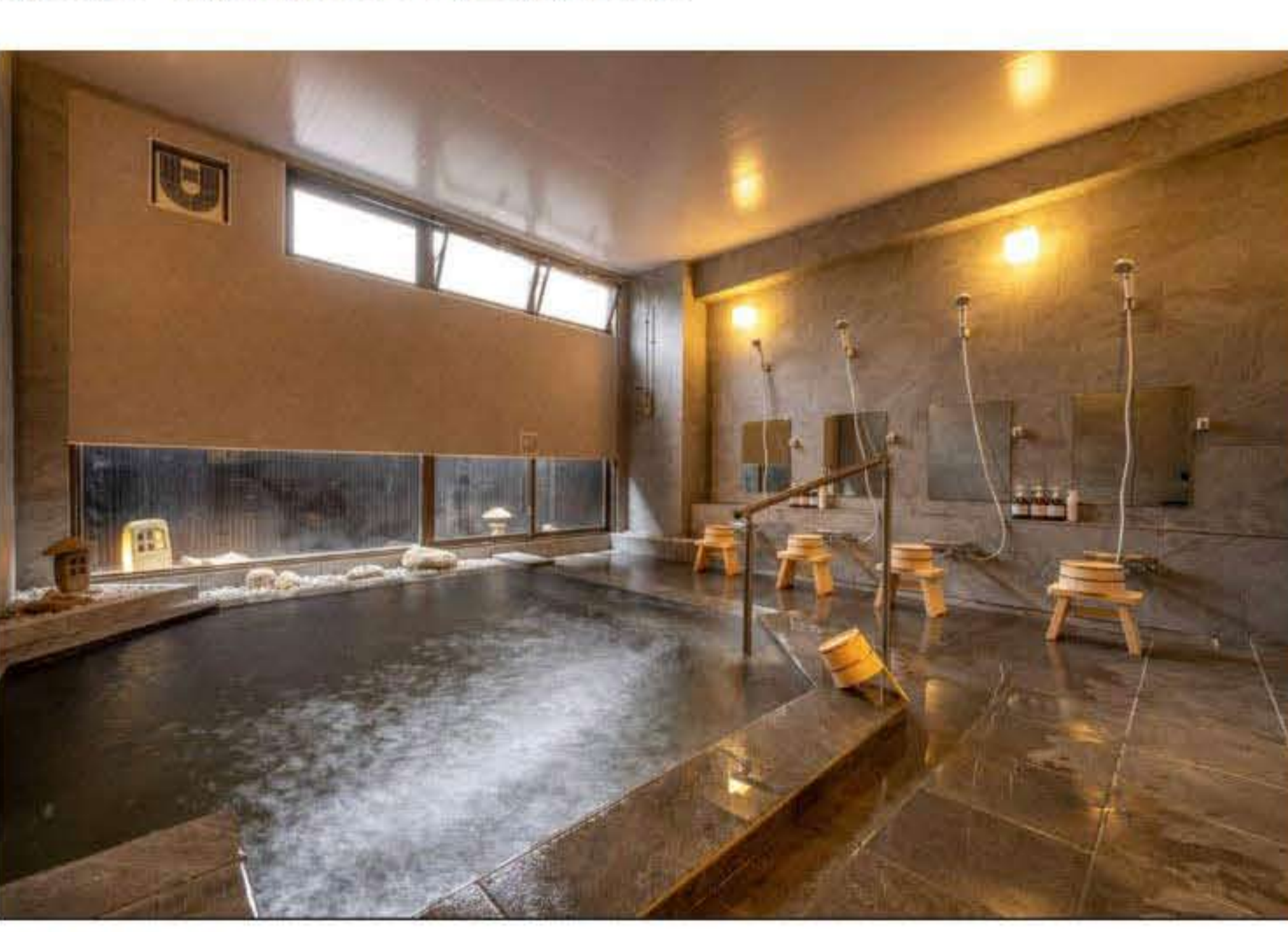
写真：大浴場（風の湯）

館内は石原和幸氏プロデュースの庭園付露天風呂や、四季折々の緑や花で溢れており、自然豊かな心を癒す空間で、「緑屋時間」をゆっくりと堪能できます。