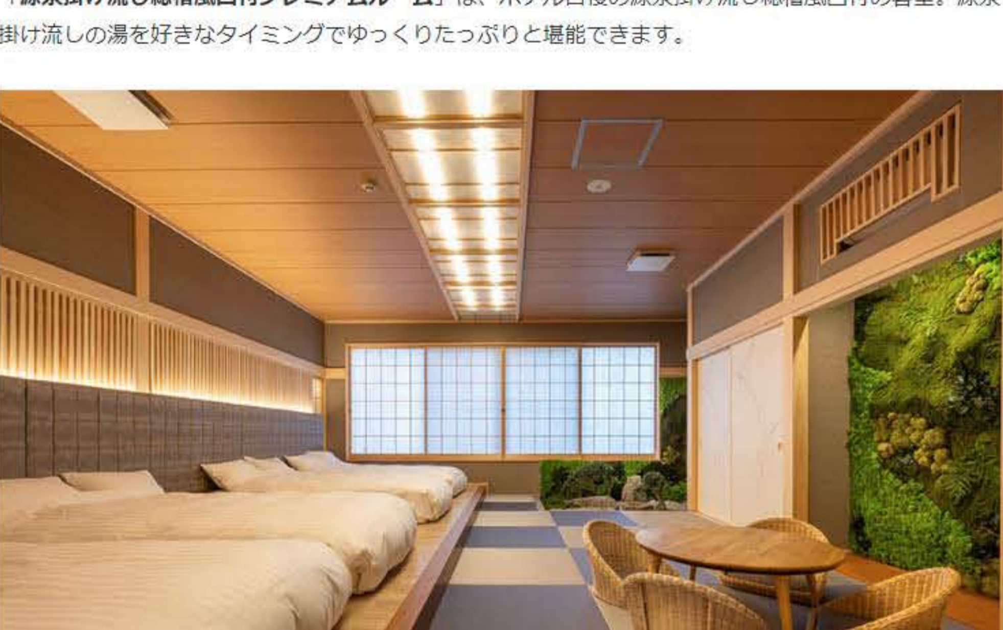
写真：ゆったりとしたベッドで心地よい眠りを！

「源泉掛け流し総檜風呂付プレミアムルーム」は、ホテル自慢の源泉掛け流し総檜風呂付の客室。源泉掛け流しの湯を好きなタイミングでゆっくりたっぷり堪能できます。