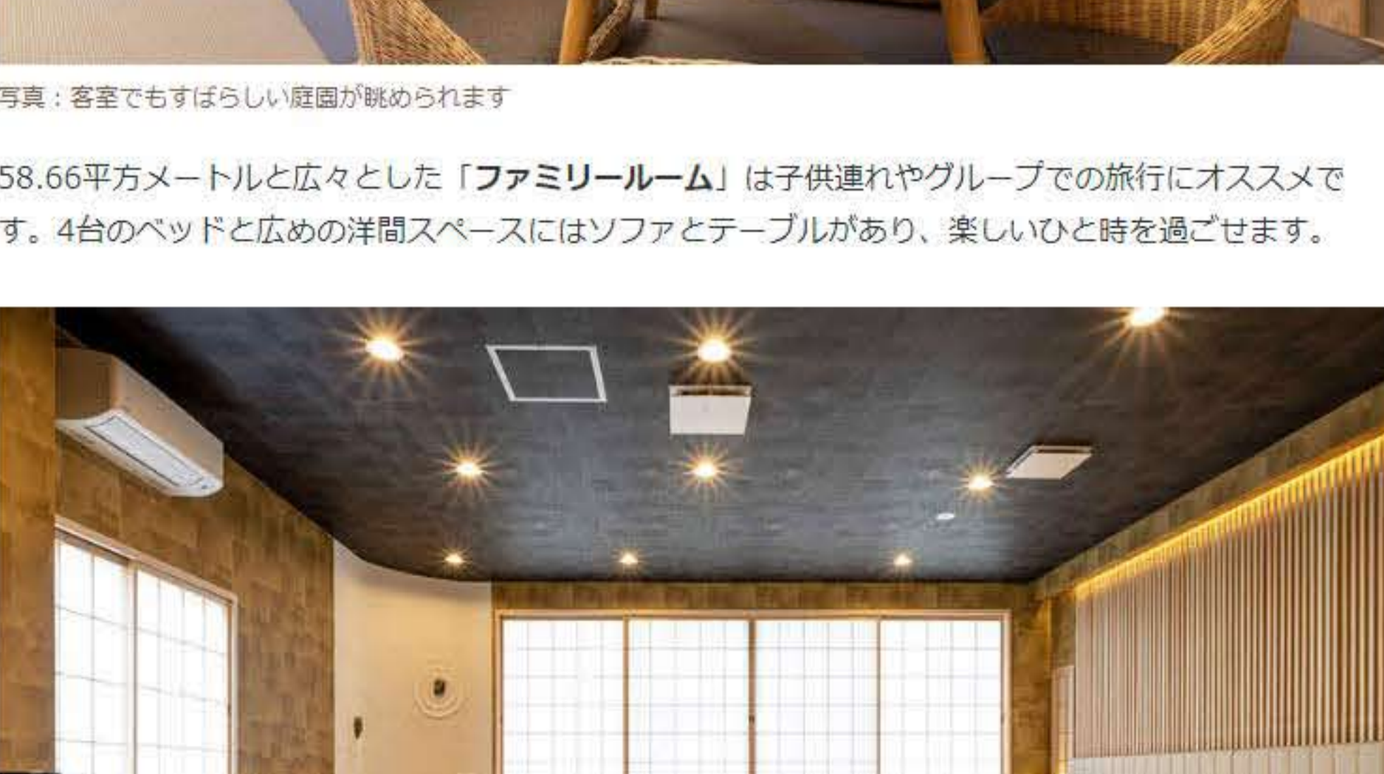
写真：広々としたファミリールーム

58.66平方メートルと広々とした「ファミリールーム」は子供連れやグループでの旅行にオススメです。4台のベッドと広めの洋間スペースにはソファとテーブルがあり、楽しいひと時を過ごせます。